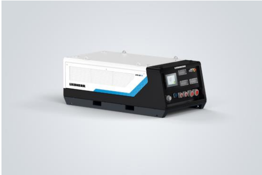
liebherr-liduro-power-port-01.jpg Liduro Power Port – LPO 80