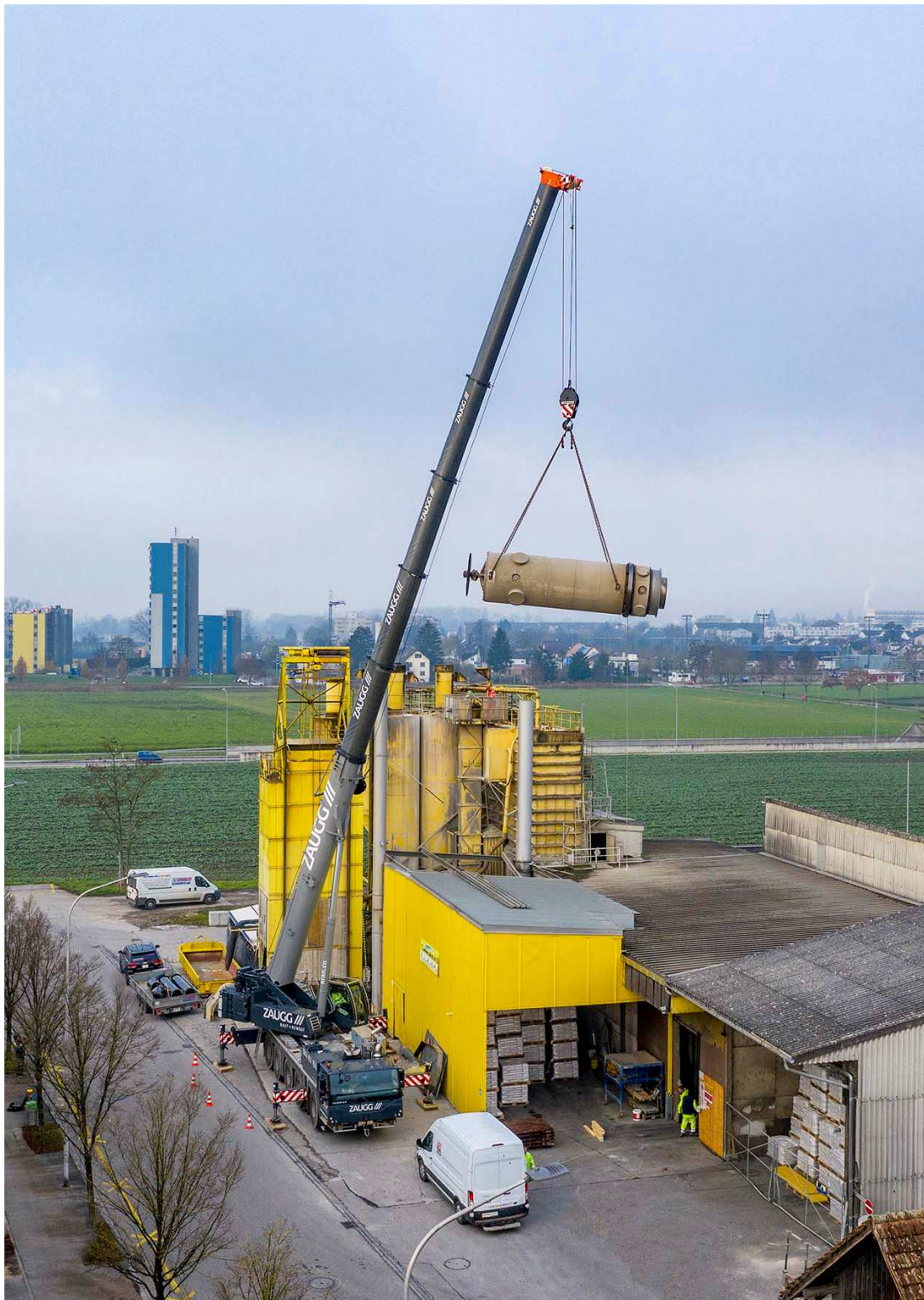
liebherr-ltm1110-5-1-zaugg-solothurn-drum.jpg Ausgebaut: Die rund 12 Tonnen schwere Trockentrommel der Produktionsanlage für Trockenbeton hängt am Haken des LTM 1110-5.1.