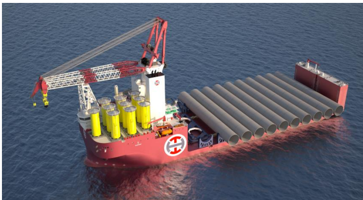
Künstlerische Darstellung von Alfa Lift mit 10 XXL-Monopiles und Übergangsstücken. Nur zu Illustrationszwecken, Bildnachweis: Ulstein.