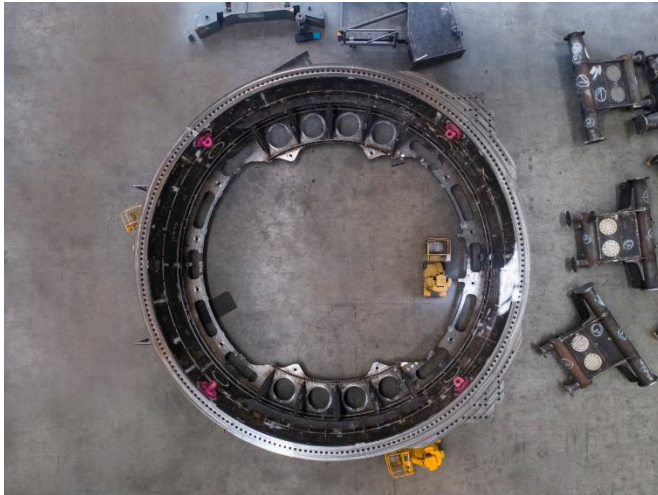
Kran in Produktion: Nur 14 Meter beträgt der Durchmesser der Drehsäule des HLC 150000-3000.