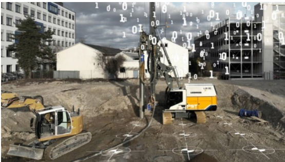
liebherr-myjobsite-02.jpg Unterschiedliche Datenquellen werden in einem Portal gesammelt.