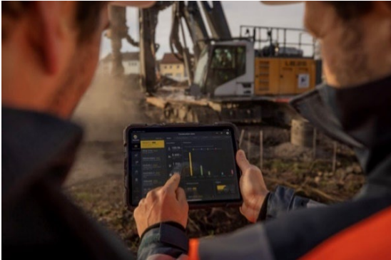
liebherr-myjobsite-01.jpg Eine Übersicht sämtlicher Baustellendaten auf Knopfdruck.