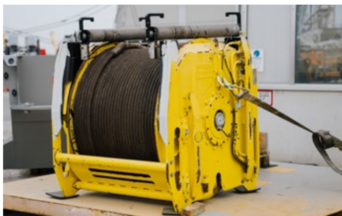
Contrôle en détail et réception de composants