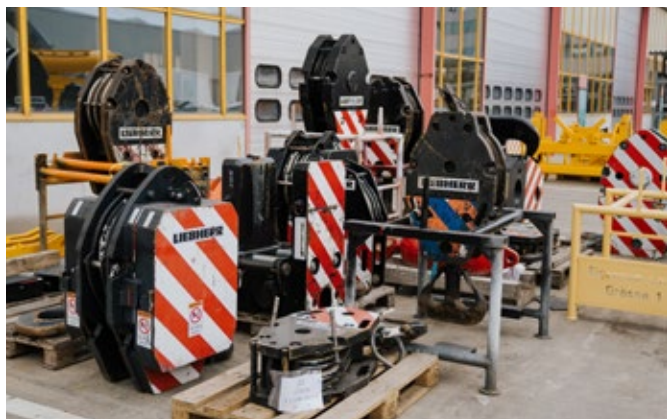
Les moufles et crochets en différentes variantes