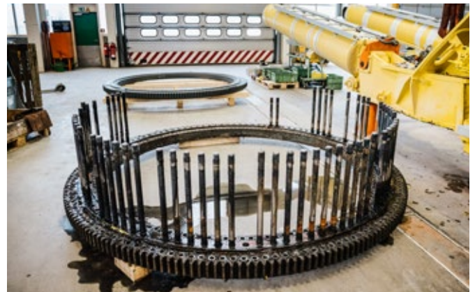
Contrôle de la couronne d'orientation suivie d'une rénovation