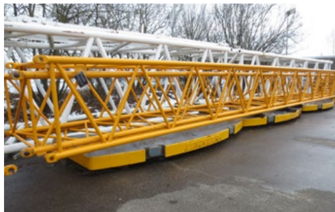
Diverses sections de flèches treillis, rallonges et fléchettes