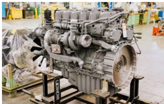
Expertise du fabricant lors de la révision du moteur