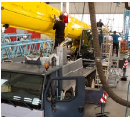
Assemblage après reconditionnement des composants