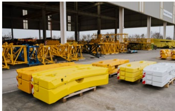
Contrepoids en différentes versions