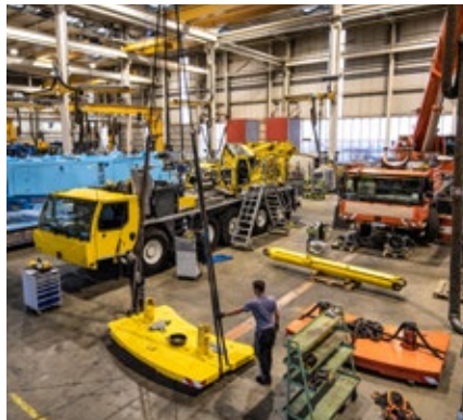
Démontage complet de la grue