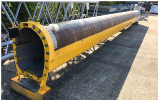
Sections télescopiques individuelles ou extensions télescopiques