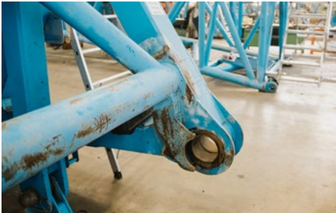
Remise à neuf de pièces d'équipement et d'éléments en treillis

la qualité, pour cela les éléments télescopiques posant problème ne sont pas réparés mais remplacés à neuf. Vous bénéficiez ainsi d'un savoir-faire professionnel de première main lors de la remise en état de votre grue d'occasion.