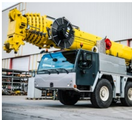
La LTM 1130-5.1 complétée quitte le hall de réparation