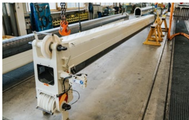
Remise en état d'une flèche télescopique