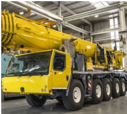
Remise en état d'une grue accidentée