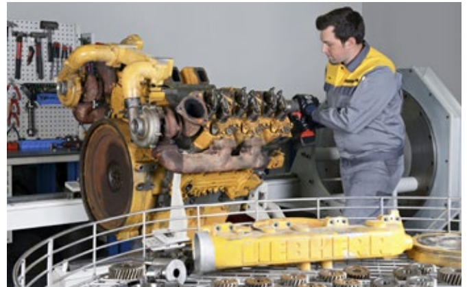
Révision des moteurs par nos spécialistes Liebherr.