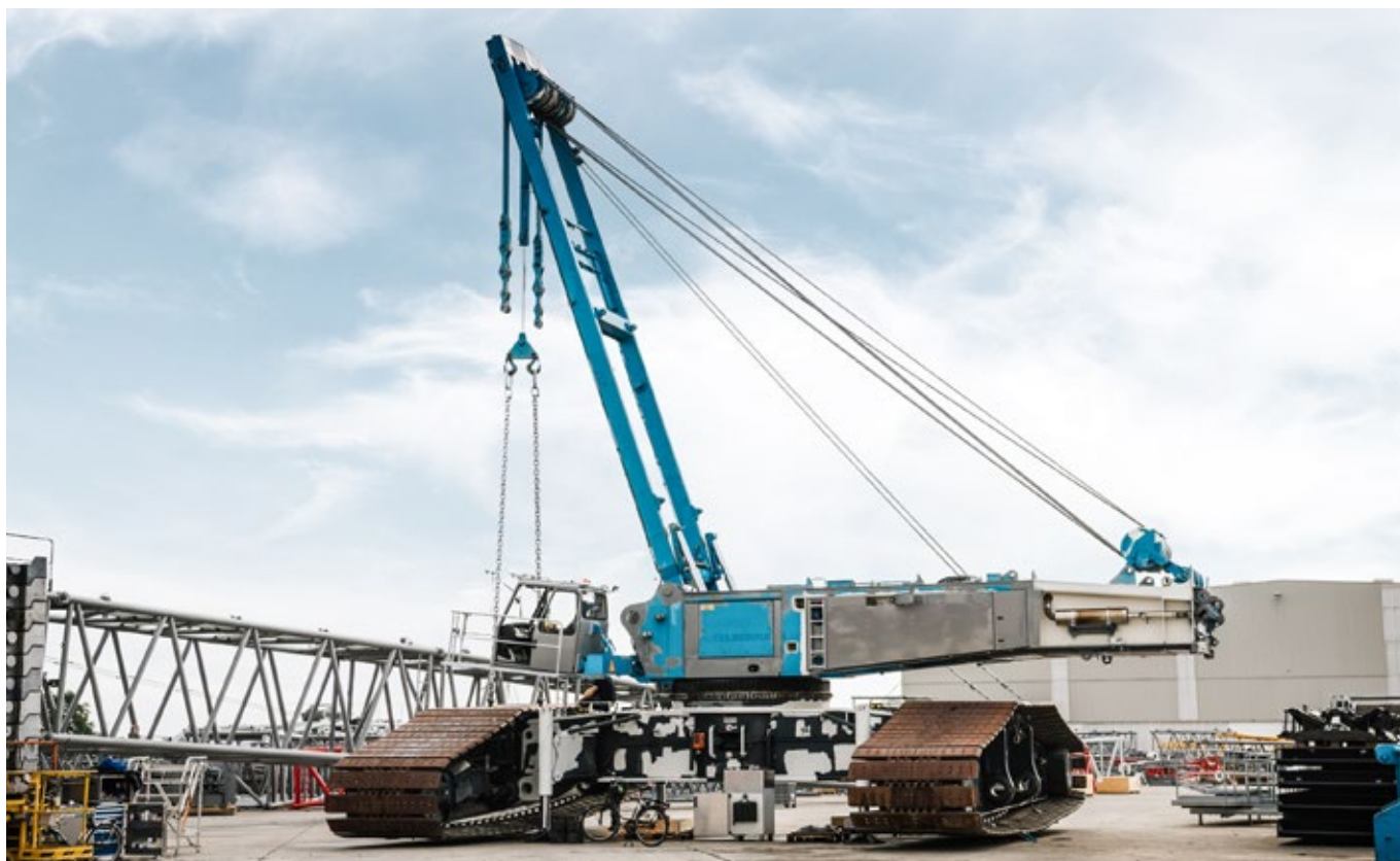
Contrôle et réception des composants