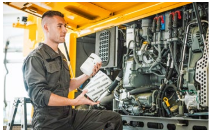
Remise en état avec des pièces d'origine Liebherr pour une fiabilité garantie.