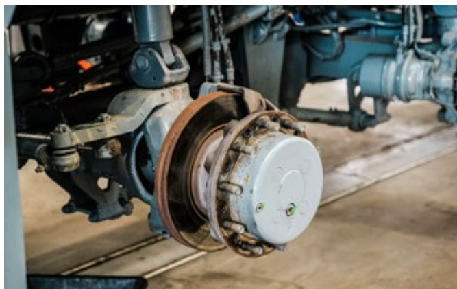
Révision technique des freins