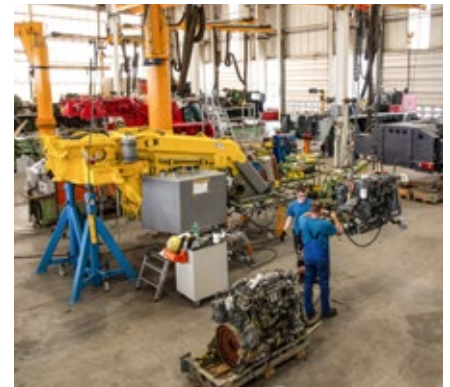
Remplacement du moteur de la tourelle et remise en état