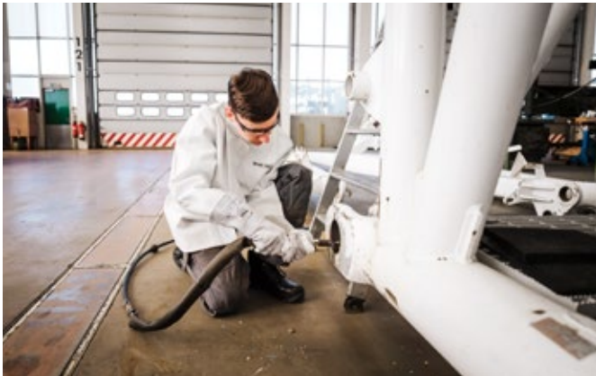
Chaque grue reçoit la dernière touche de finition avant d'être livrée.

Liebherr est l'un des plus grands revendeurs de grues mobiles et sur chenilles d'occasion. Nous sommes à vos côtés et vous proposons la prise en charge de la gestion de l'expertise en collaboration directe avec votre assurance.