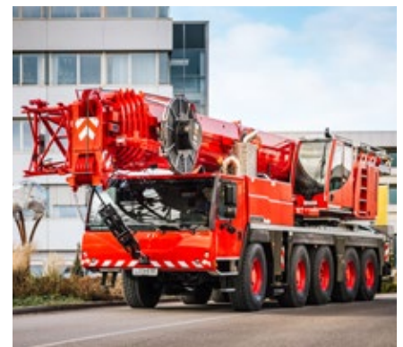
La grue d'occasion révisée et repeinte en route vers son nouveau propriétaire